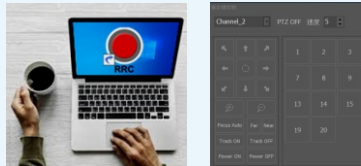
*Remote Rec Controller

可透過網路遠端管控錄播主機 開關機、錄停、場景切換、影音預視(輸出及來源)、直播金鑰、檔案播放/下載、控PTZ雲台攝影機]